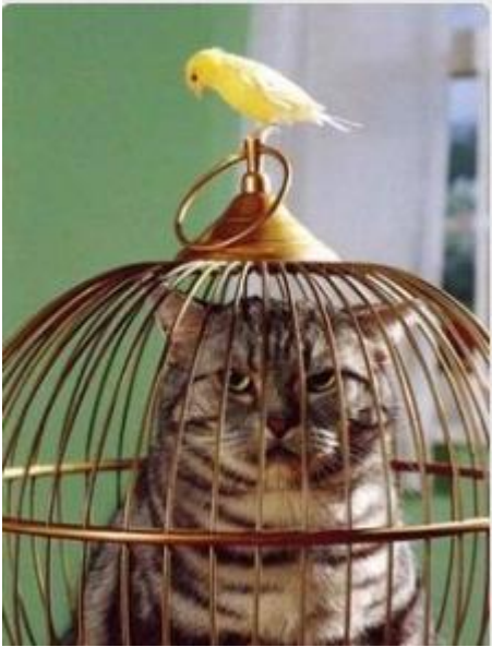
DE KAT EN DE VOGEL

HEEL LANG GELEDEN WAREN ER EEN MENEER EN EEN MEVROUW. ZE HADDEN EEN KAT EN EEN VOGEL. DE VOGEL ZAT IN EEN KOOI EN DE KAT LIEP LOS. OP EEN DAG WAS DE KOOI OPEN MET DE VOGEL ER IN. DE KAT ZAG DAT NATUURLIJK. HIJ KEEK ROND HIJ DAGT NIEMAND TE ZIEN. HIJ KEEK WEER NAAR DE KOOI EN DE VOGEL. EN RENDE NAAR DE KOOI. DE VOGEL ZAG DAT EN VLOOG SNEL UIT DE KOOI. DE KAT RENDE NOG STEEDS EN BAM. HIJ ZAT IN DE KOOI EN HET DURTJE ZAT DICHT. DE VOGEL GING OP DE KOOI ZITTEN. EN TOEN KWAAM HET BAASJE BINNEN.